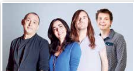
L'équipe de Snooze