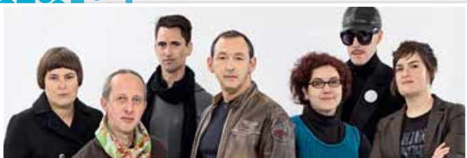
Bang Bang Team